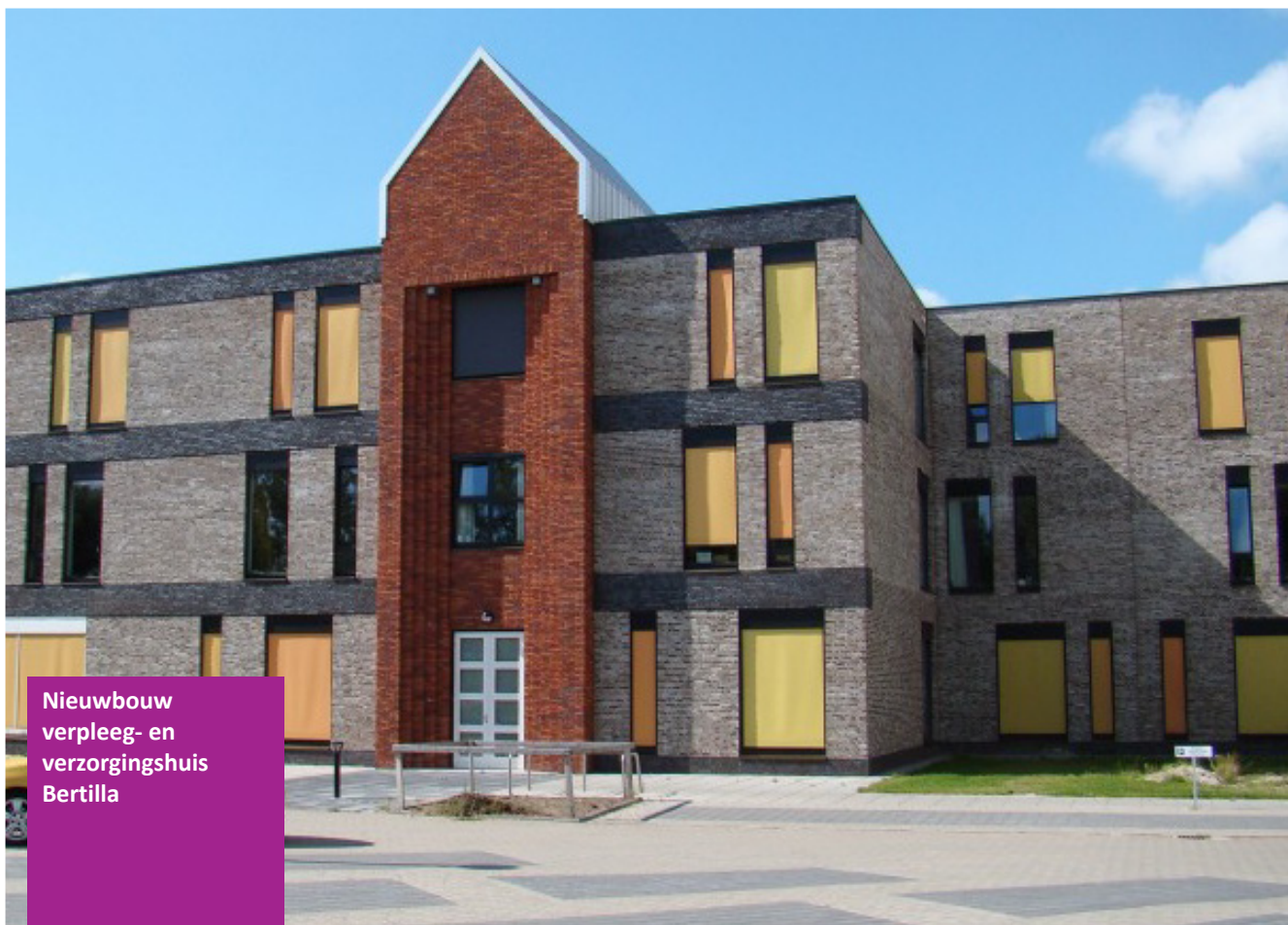
Nieuwbouw verpleeg- en verzorgingshuis Bertilla